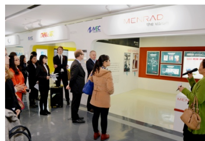
Ein eigener Showroom in der MEC-Expo ist der erste Schritt des Markteintritts – die hdt Anlagenbau GmbH wird hier über ihre Produkte informieren.